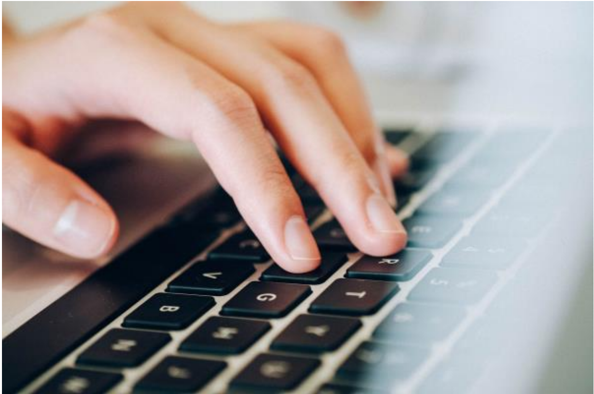
3 - Osallista

Sanattoman viestinnän puuttuessa kosketa muita virtuaalisesti.