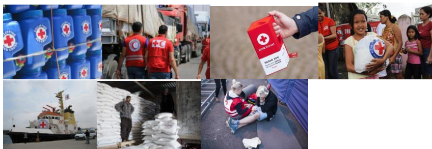
Bild 1: Vattenkanistrar efter en orkan i Filippinerna. Symbolen anger att kanistrarna hör till organisationen.

Bild 2: Frivilliga inom Röda Halvmånen i Syrien och en anställd vid internationella Röda Korset. Symbolen skyddar biståndsarbetare i krigsområden.