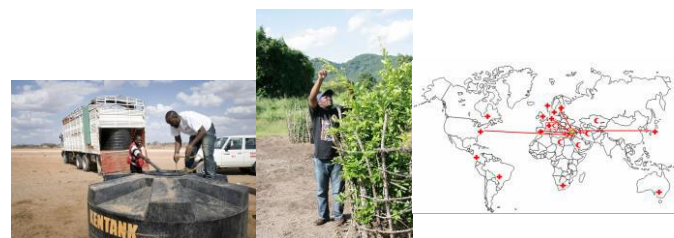
Bild 1: Röda Korset i Kenya delar ut vatten inom områden som drabbats av torka. Bild 2: Röda Korset handleder i nya odlingstekniker.

Från Finland kan man skicka ut till exempel mat och läkemedel. Finländare kan också till exempel undervisa lokalbefolkningen i bättre odlingsmetoder för torka och översvämningar eller berätta för dem hur de kan undvika smittsamma sjukdomar. Det viktigaste är att man hjälper lokala frivilliga och sammanslutningar att komma igång. Hjälp skickas ut alltid på begäran av Röda Korset eller Röda Halvmånen i det drabbade landet.