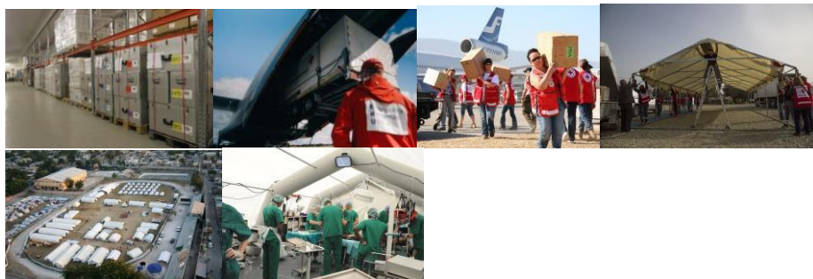
Bild 1: Ett färdigt packat fältsjukhus i logistikcentralen Kalkku, bild 2: sjukhuset flyttas till flygplanet, bild 3: sjukhuset lossas i Haiti, bild 4: sjukhuset uppförs, bild 5: det färdiga sjukhuset i Haiti och bild 6: operationssalen i sjukhuset.

I Tammerfors ligger logistikcentralen Kalkku varifrån man snabbt kan skicka i väg material till katastrofdrabbade områden. Där finns tält, filter, sjukhusredskap och även ett helt sjukhus i lager. Fältsjukhuset och logistikcentralen är med andra ord en del av beredskapen inför akuta situationer.