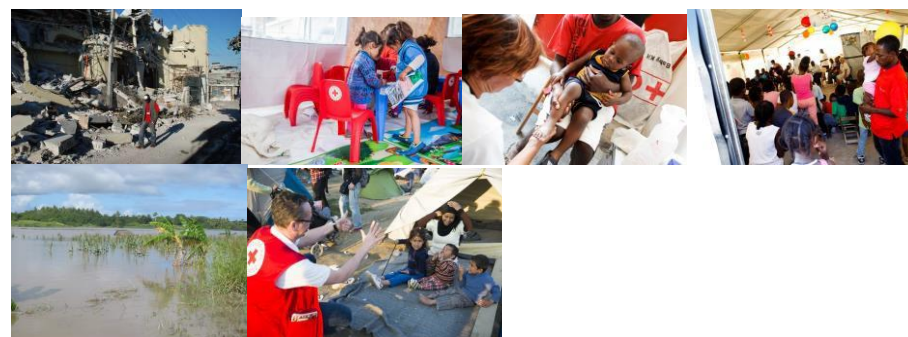
Bild 1: Bild på ett jordbävningsdrabbat område i Haiti, frivilliga och lokalinvanare kontrollerar ruinerna.

På bilderna finns exempel på katastrofarbetet under och efter katastrofe