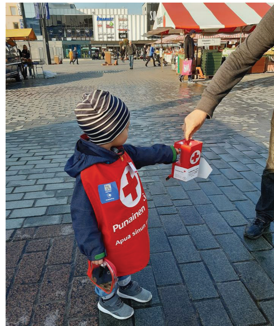
Lauantain keräyspäivä alkoi aurinkoisena Muraliman Navalla Kuopiossa, kuva: Hanna Putkonen