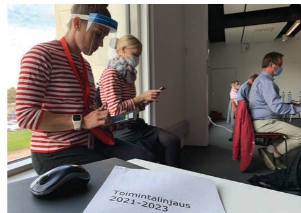
Punainen Risti Varsinais-Suomen piiri