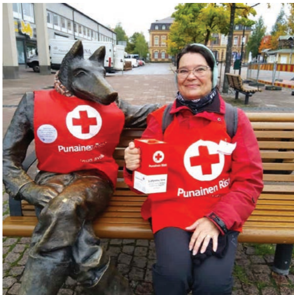
Joensuun osasto puki torin laidalla päivystävät Kosi-osuden ja Morshukan keräysliiveihin, kuva: SPR Joensuun osasto

Kiitos kaikille osastoillemme ja keräykseen osallistuneille vapaaehtoisille sekä lahjoittajille!