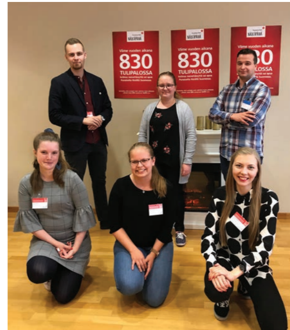
Yleiskokouksen nuoret edustajat.