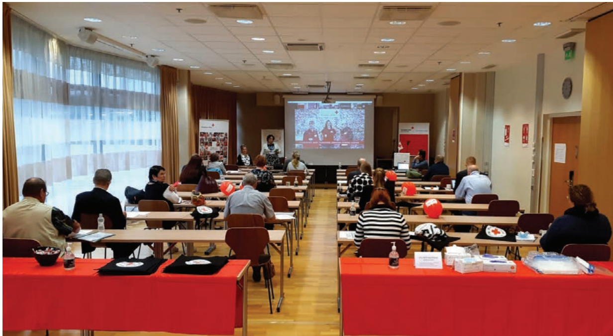
Kokoussali Kimmelissä, josta yhteys Vaasaan.