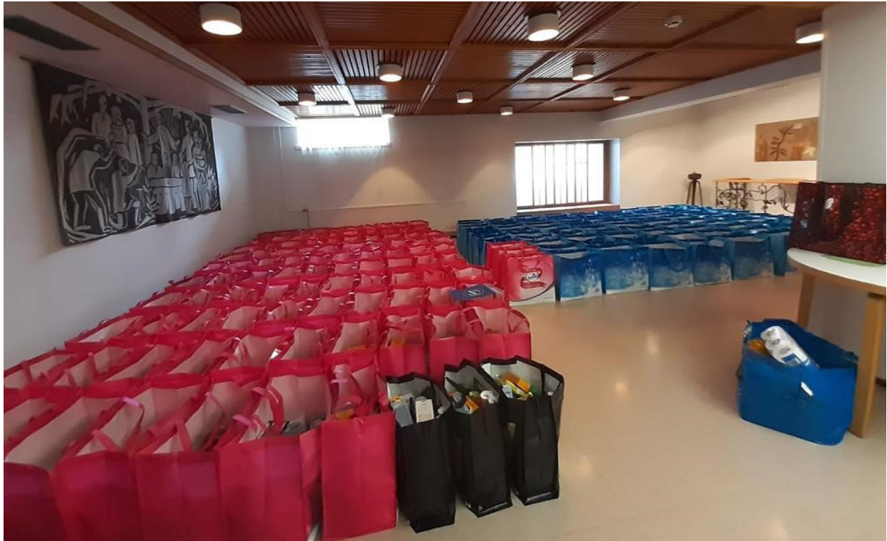
Ruokapussi sisältöineen, 200 ruokapussia odottaa seurakunnan kappelissa.

Outokummussa heräsi huoli lapsiperheistä, kun koronan takia monen perheen toimeentulo muuttui epävakaaksi. Lapset jäivät kotiin opiskelemaan. Ruoka-apu tuntui parhaalta tavalta auttaa Outokumpulaisia perheitä. Yhdessä Mannerheimin Lastensuojelu Liiton, seurakunnan, Perheiden paikan, Rikkaveen kyläyhdistyksen ja Lions Club Outokumpu/kuparin kanssa päätimme järjestää ruokakeräyksen 200 lapsiperheelle. Ruokapussit oli määrä jakaa äitienpäiväksi, lauantaina 9.5.