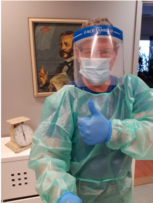
Tilaisitko tältä mieheltä suojaimet?